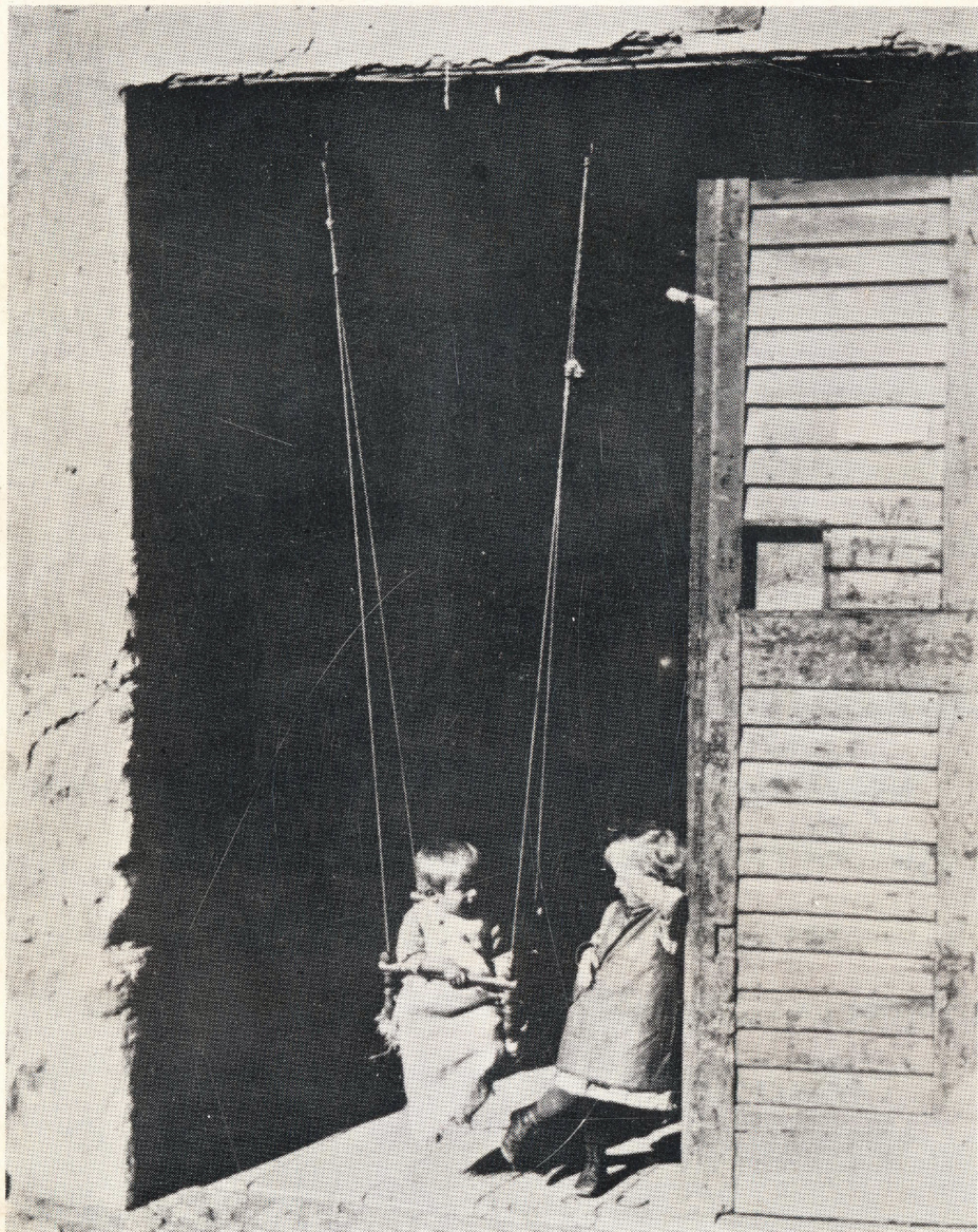
ANDRÉ KERTÉSZ MAGYARORSZÁGI FÉNYKÉPEI ESZTERGOM-VÁRMŰZEUM-1982