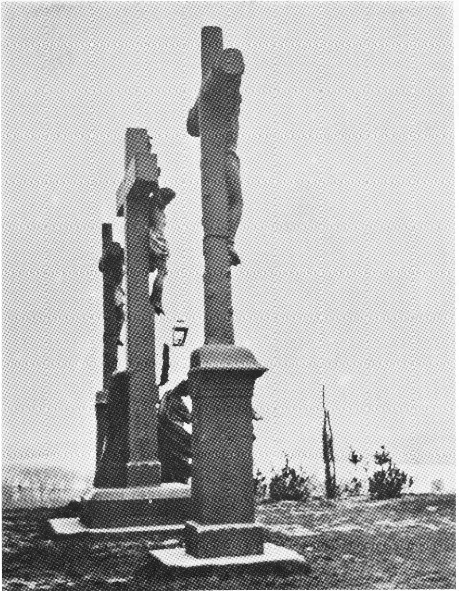
A KIÁLLÍTÁST HORVÁTH BÉLA RENDEZTE LABORMUNKA: LENCSEŠ TAMÁS